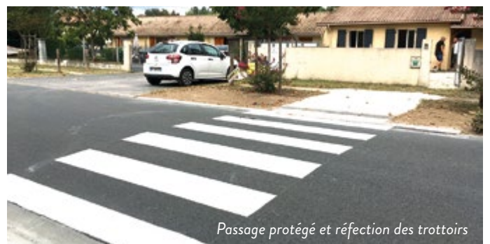
Passage protégé et réfection des trottoirs