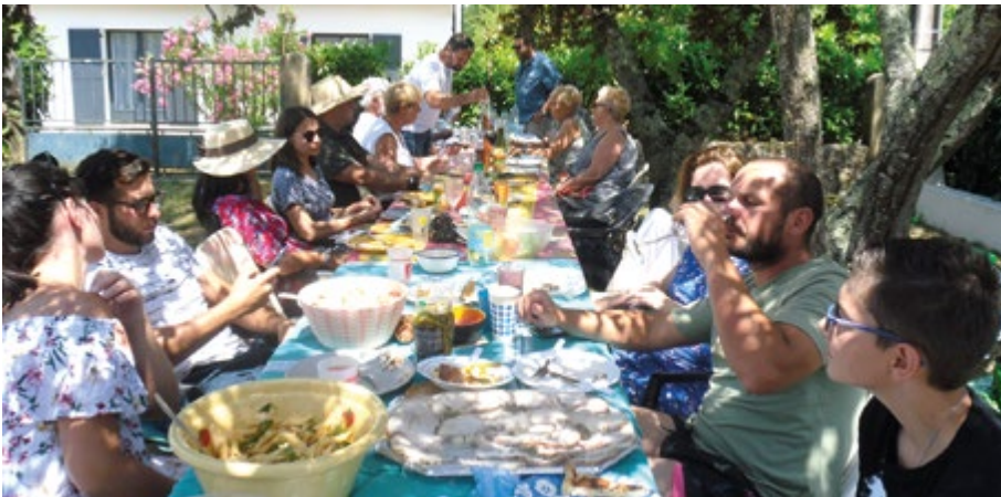
Repas de quartier - Onze propriétaires du quartier La Troude ont «fêté les voisins» le samedi 5 juillet autour d'un déjeuner très convivial sous le soleil.