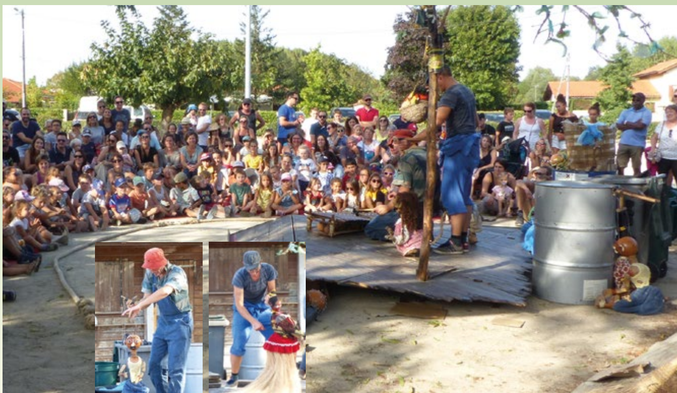
Spectacle de marionnettes