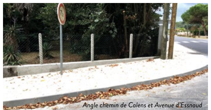
Angle chemin de Calens et Avenue d'Essnaud