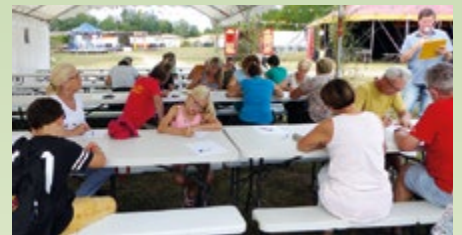
La grande dictée