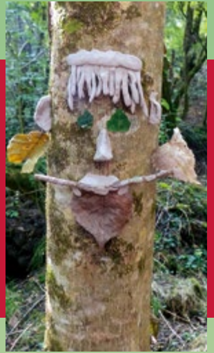
Balade du samedi matin