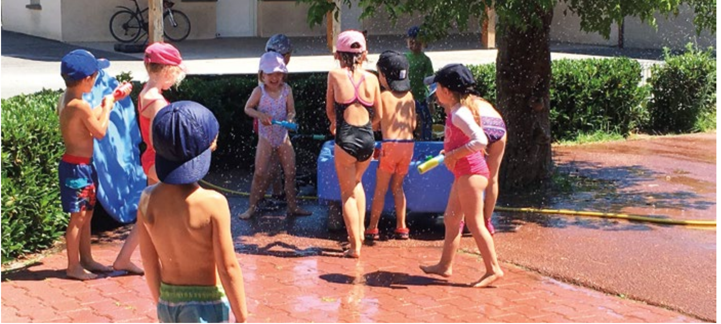
ALSH - Jeux d'eau...