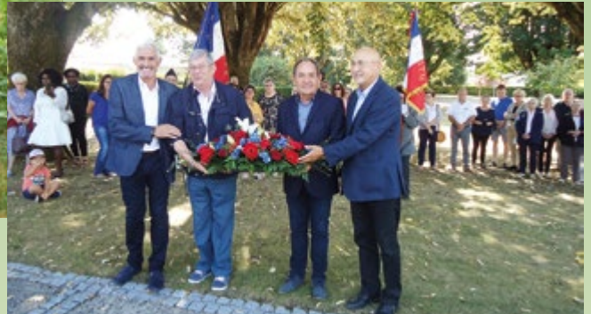
Dépôt de gerbe le dimanche