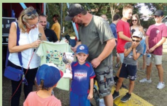
Remise des prix aux deux gagnants