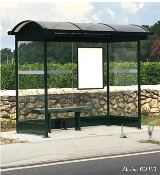
Abribus RD 1113