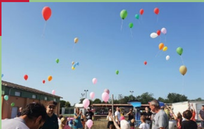
Lâcher de ballons