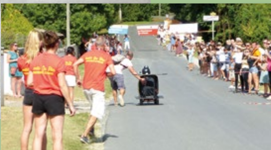
Course de caisses à savon